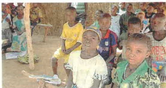
Anche in questo tempo difficile, donare con gioia è condividere ciò che il Signore ci dona.