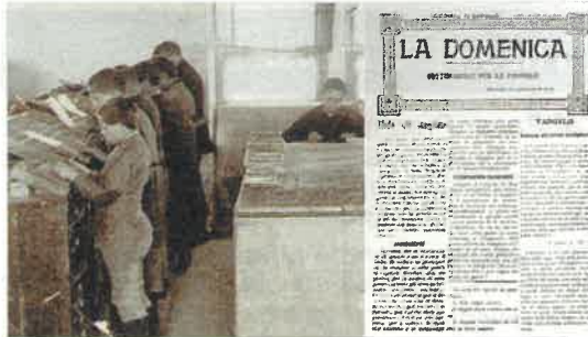
A destra: uno dei primi numeri de «La Domenica». A sinistra: i giovani della Scuola Tipografica al lavoro.