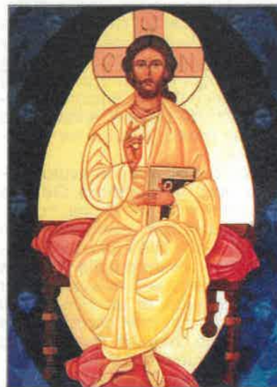
«Noi abbiamo contemplato la sua gloria, gloria come del Figlio unigenito che viene dal Padre, pieno di grazia e di verità».