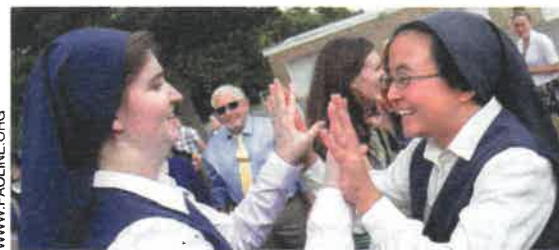
«La presenza dei religiosi è segno di gioia. Quella gioia che scaturisce dall'esperienza intima di Dio che riempie il nostro cuore e ci rende davvero felici» (papa Francesco).